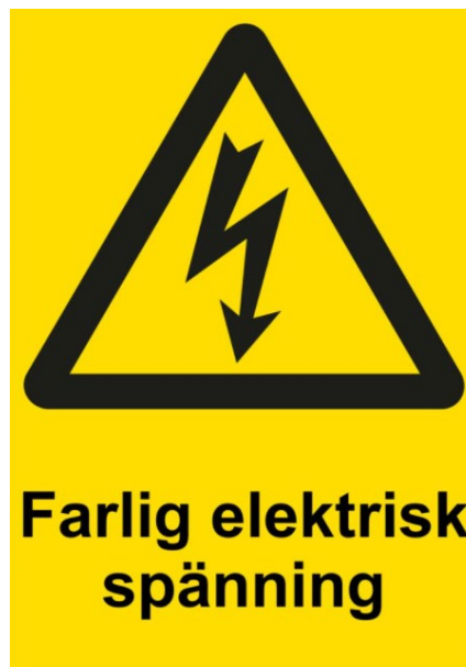
Figur 2. Exempel på utformning av skylt för varning för elektrisk spänning