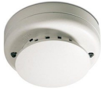
Bild: Exempel på rökdetektor.