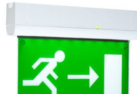
Bild: Genomlysande utrymningsskylt.