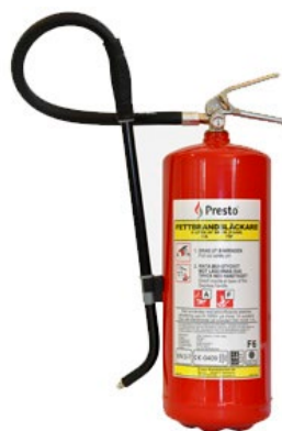
Bild: F-släckare så kallad fettsläckare.

Vilket släcksystem ett kök med fritös ska ha beror även på andra faktorer. Se bilden nedan: