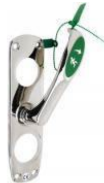
Bild: Trycke enligt SS-EN 179.