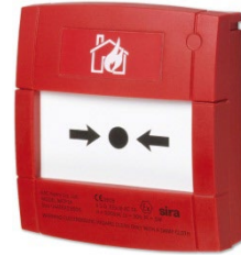
Bild: Knapp för manuell aktivering av utrymningslarmet.